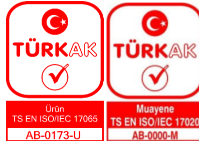
Şekil 2- Türkak Akreditasyon Markası

Akreditasyon sonrası yukarıda şekil 2'deki Muayene logosunun en altında bulunan "0000" yerine Ürün logosunda olduğu gibi Türkak tarafından EUTEST'e özel verilen numaralar eklenerek EUTEST akreditasyon markaları oluşturulacaktır.