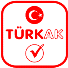
Şekil 1 – Türkak Logosu

Akreditasyon markası: Akreditasyon kuruluşunun (TÜRKAK) tarafından EUTEST'in akreditasyon statülerini göstermek için kullandığı semboldür. Akreditasyon Markası TÜRKAK logosunun altına akreditasyon alanı, akreditasyona konu olan standardın numarası ve EUTEST'in akreditasyon numarasının eklenmesi ile oluşturulur.